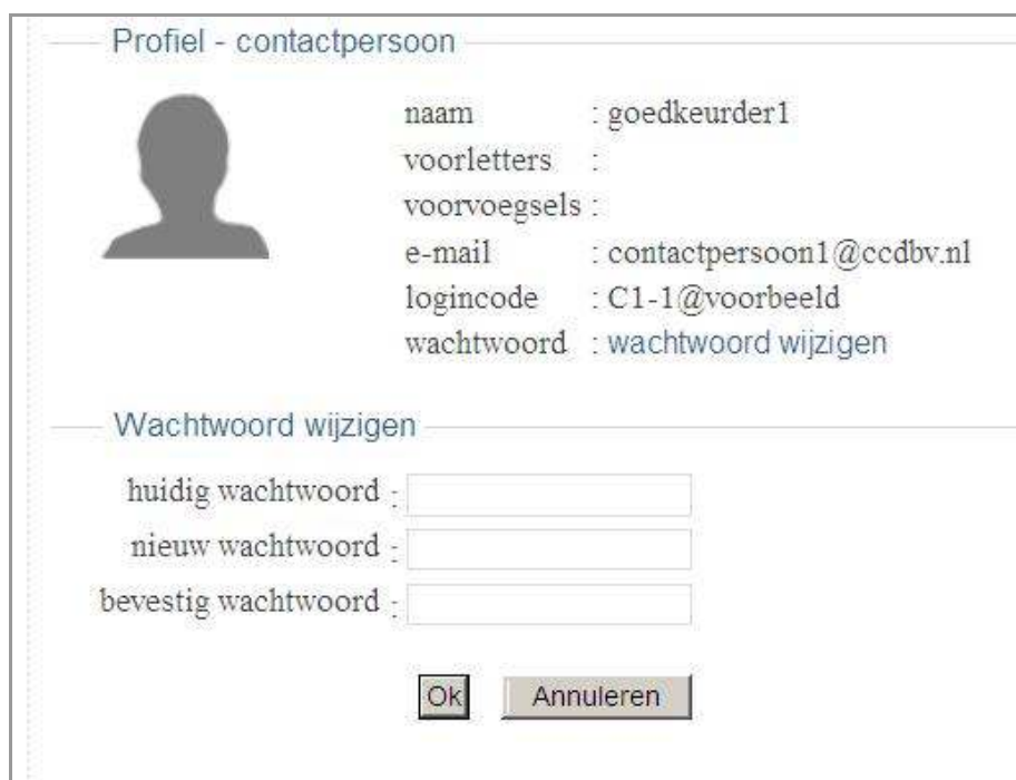
figuur 3.2: Wachtwoord wijzigen

Selecteer de optie wachtwoord wijzigen om uw wachtwoord te kunnen wijzigen.