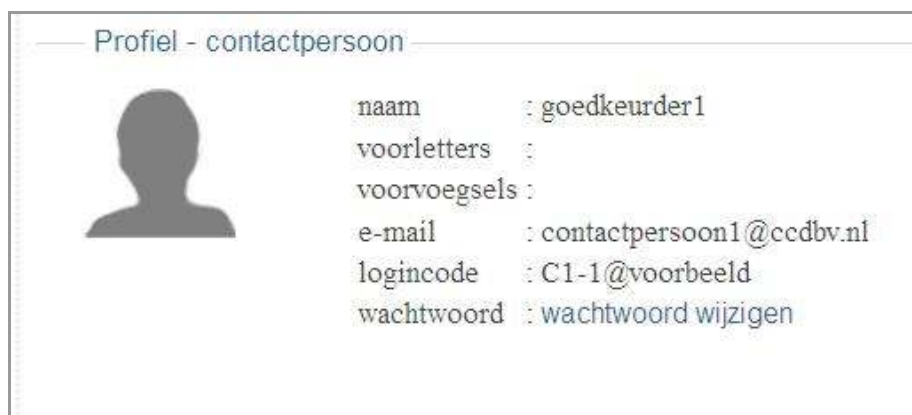
figuur 3.1: Persoonsgegevens

Door rechtsboven in het scherm op uw naam te klikken krijgt u uw persoonsgegevens te zien.